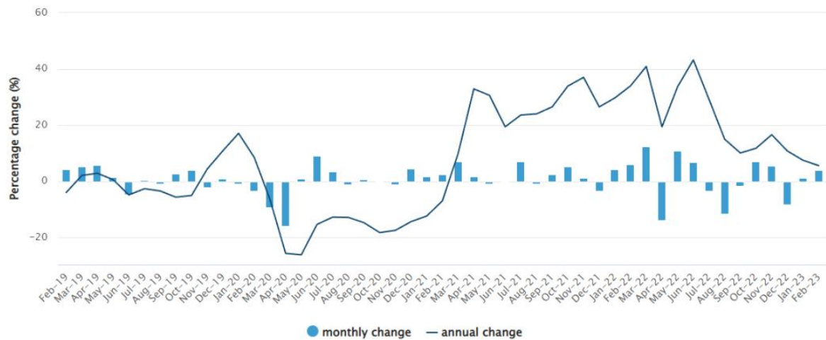
Automotive fuel, Australia, monthly and annual movement (%)

本月的旅游和娱乐价格有所缓和，截至 2023 年 2 月份，年增长率为 6.4%，较 2023 年 1 月的 10.2% 有所降低。这主要是因为假期旅行和住宿价格从 1 月份的年增长率 17.8% 降至 2 月份的 14.9%。Marquardt 女士表示：“自去年 12 月份上涨了 29.3% 之后，假日旅游和住宿价格已经缓和至 2023 年 2 月份的 14.9%。这种缓解是由于在圣诞节前的 12 月份，国内和国际机票需求旺盛，而 1 月份学校假期期间住宿价格仍然居高不下。”